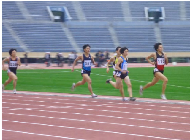
熱戦を繰りひろげる選手たち。10個の大会新がでた。表彰風景 (プレゼンターに和食理事長、北出全国RC会長)