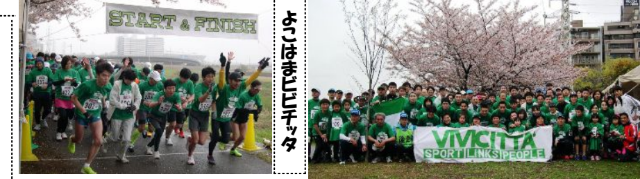
4月5日(日)2015よこはまVIVICITTAが小雨混じりの新横浜アリーナ脇鶴見川「よこはま月例会場」で開催されメイン12km、3km、1kmに170名が走りました。