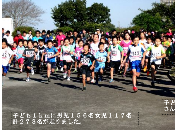
子ども1kmに男児156名女児117名 計273名が走りました。

月例終了当日の間合せは市連盟事務所 044-433-1120へ 郵便振替での葉権届は 下記へ 名義: 新日本スポーツ連盟RC 番号: 00260-4-33100