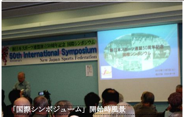
「国際シンポジウム」開始時風景